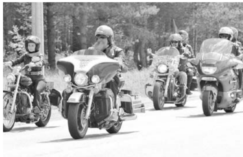
Пресс-служба губернатора и правительства Ленинградской области Фото А. Дубинина